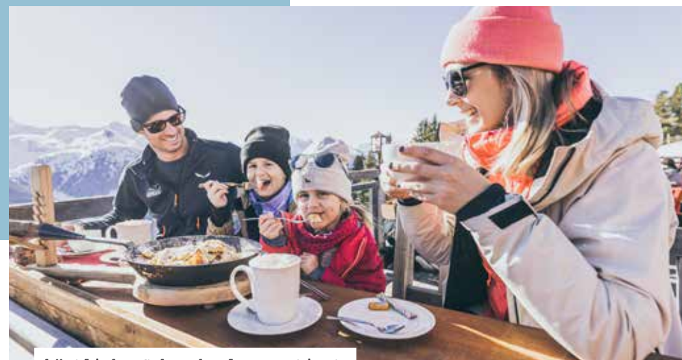
köstliche Schmankerl garantiert

Detaillierte Hüttenübersicht auf www.zillertalarena.com The detailed culinary offer on www.zillertalarena.com