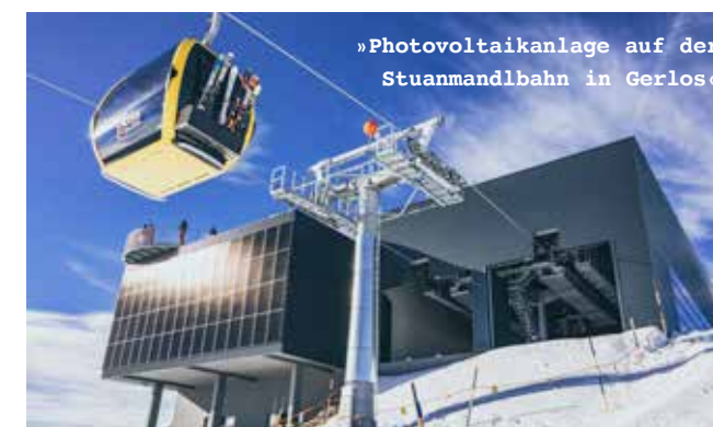
»Photovoltaikanlage auf der Stuanmandlbahn in Gerlos«

In Gerlos, a biomass heating plant was already commissioned in 2014, which will supply about 130 houses in Gerlos. Four photovoltaic systems are also in operation in the Zillertal Arena. With the energy from the latest system at the Stuanmandlbahn in Gerlos, more than 640,000 people can be transported on the Vorkogel t-bar lift per season in a CO 2 -neutral way. Outside of operating hours, the electricity generated is fed into the public grid. In addition to an additional economic benefit, this makes an active contribution to sustainable energy generation. In