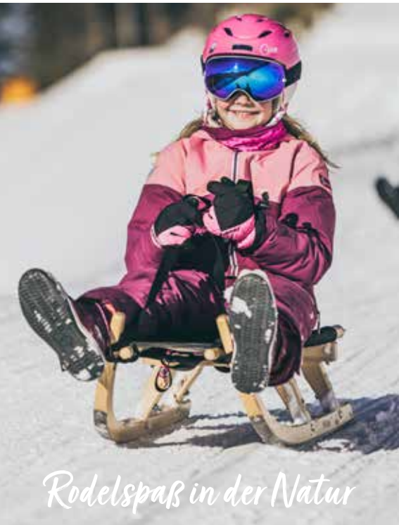
Rodelspaß in der Natur

Damit aus dem Rodeln ein echtes Erlebnis für die ganze Familie wird, sind ein paar Regeln zu beachten: