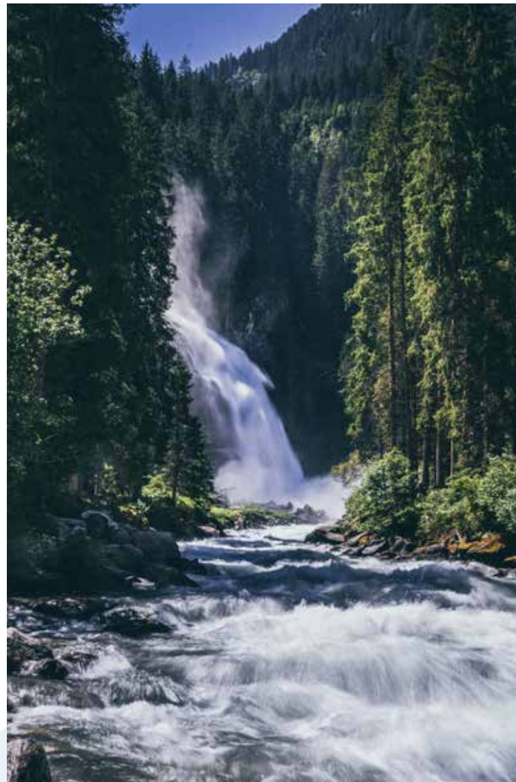
Der außergewöhnliche Sprühnebel der Krimmler Wasserfälle bietet von Mitte Mai bis Ende September optimale Therapiebedingungen. Individuelle Therapiepakete können von 21. Mai bis 24. September 2022 gebucht werden.

D ie Krimmler Wasserfälle sind nicht nur die größten Wasserfälle Europas, sondern auch ein einzigartiges natürliches Heilmittel bei Allergien und Asthma! Schon Anfang des 19. Jahrhunderts nutzte der damalige Landarzt Dr. Oberlechner die Krimmler Wasserfälle als Therapie bei allerlei verschiedenen Erkrankungen. Das Geheimnis des heilsamen Effektes steckt im feinen Sprühnebel der Wasserfälle, welcher aus winzig kleinen negativ geladenen Tröpfchen besteht. Diese so genannten Wasserfall-Aerosole entstehen beim Aufprall des Wassers am Felsen: Durch die Wucht des Wassers werden die einzelnen Wassermoleküle regelrecht in kleinere Teilchen zerschmettert. Die negativ geladenen Teilchen, die dabei entstehen, sind ca. zweihundert Mal kleiner als die Tropfen eines Asthmasprays. Aufgrund ihrer geringen Größe können die Wasserfall-Aerosole besonders tief in die Atemwege vordringen und dort ihre reinigende und immunmodulierende Wirkung entfalten. Allergie- und Asthmabeschwerden verschwinden, die Lungenfunktion verbessert sich und das Immunsystem von Allergikern und Asthmatikern findet sein Gleichgewicht wieder. Bei einer Therapiedauer von 14 bzw. 21 Tagen kann mit einer anhaltenden Verbesserung von bis zu 4 Monaten gerechnet werden. Die Hohe Tauern Health Therapiepakete bieten Ihnen optimale Therapiebedingungen für einen bestmöglichen Gesundheitserfolg!