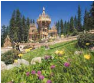
FICHTENSCHLOSS Lasst euch im Fichtenschloss verzaubern!