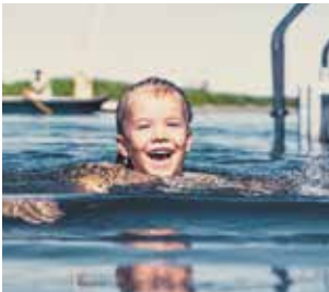
FICHTENSEE Ab ins kühle Nass des Fichtensees auf der Rosenalm.