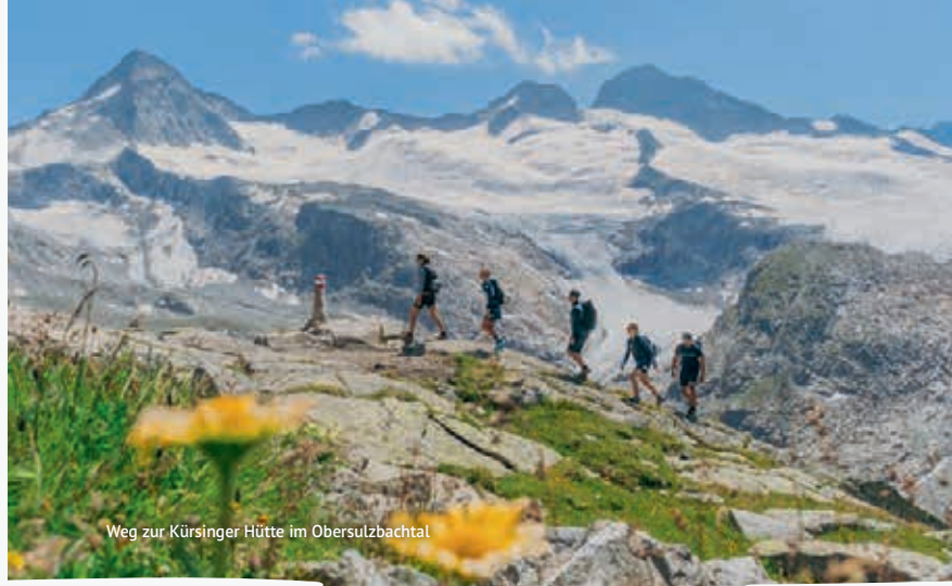
Weg zur Kürsinger Hütte im Obersulzbachtal

Alpinus Verein, wildalm@alpinus-verein.at, www.alpinus-verein.at